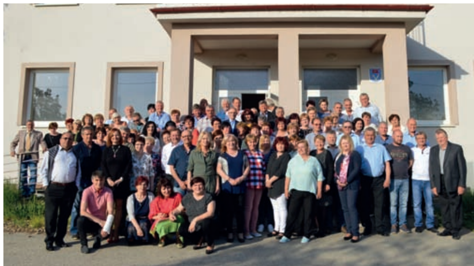
Všetci účastníci stretnutia sa odfotili na schodoch kultúrneho domu.