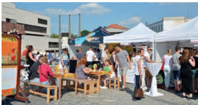
Minulý rok boli gastronomické prevádzky na Svätoplukovom námestí