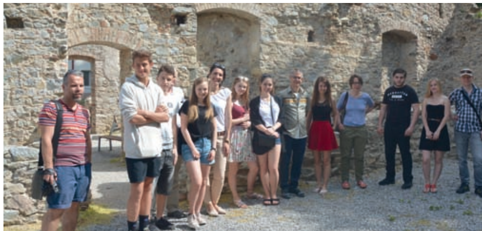
Zahraničné delegácie si v rámci dvojdiňového workshopu v Nitre prezreli i výsledky pokračujúcich rekonštrukčných prác zoborského kláštora.