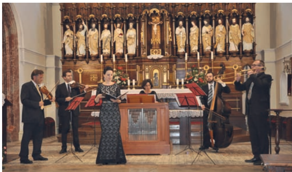
Na otváracom koncerte festivalu Musica sacra účinkovalo v minulom roku komorné zoskupenie Concillum Musicum z Viedne.