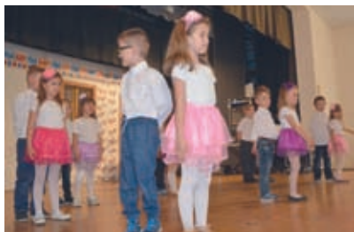
V Dražovciach sa páčili deti z miestnej MŠ.

Všade bol pripravený bohatý a pestrý program, v ktorom účinkovali deti z